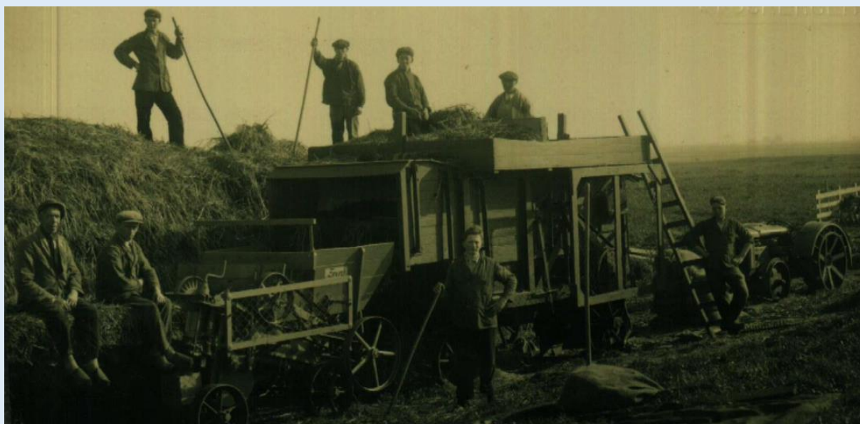
Dorsen aan de Cliffordweg, begin twintigste eeuw

Onder de verantwoordelijkheid van de historische vereniging De Proosdijlanden geeft de Stichting Proosdijer Publicaties dit najaar een rijk geïllustreerde uitgave over de historie van Waverveen uit. Dan verschijnt 'Waverveen, van boeren, burgers en buitenlui' .