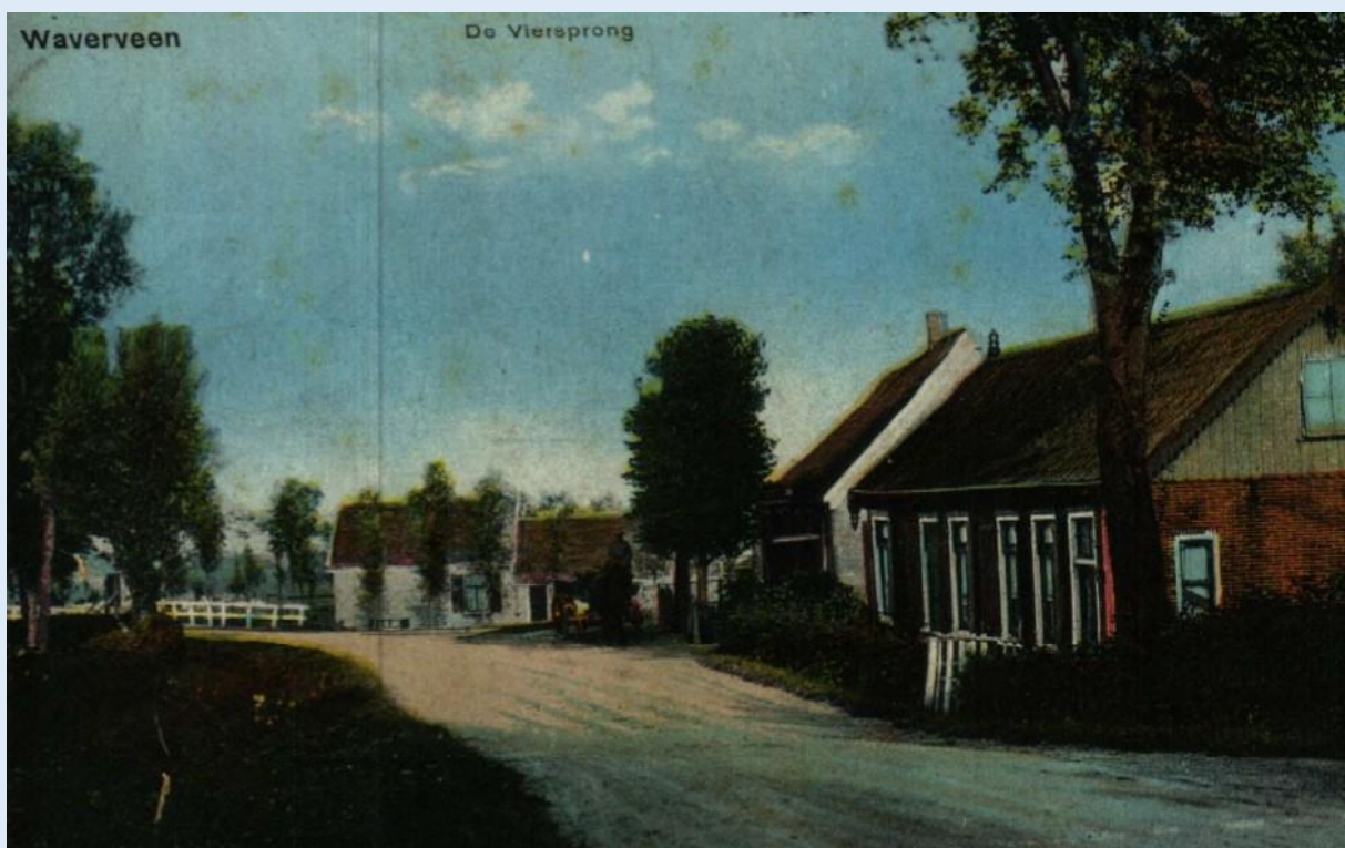
Waverveen, de Viersprong