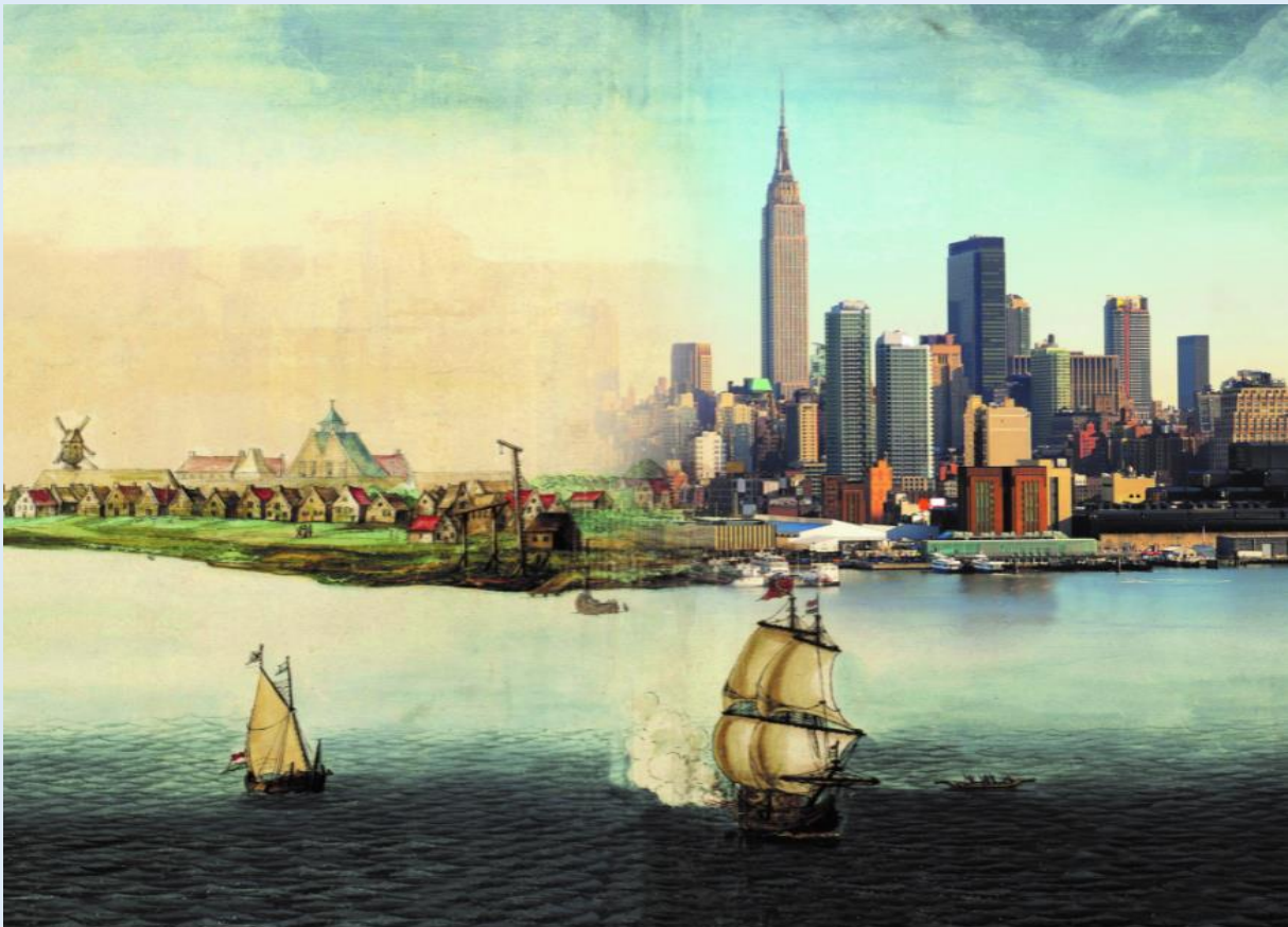
Afbeelding: Gezicht op Nieuw Amsterdam, 1646, Johannes Vingboons (1616–1670) | Skyline New York

Op 21 mei is het 375 jaar geleden dat het dorp Breuckelen, dat uitgroeide tot de wijk Brooklyn in New York, in de Verenigde Staten werd gesticht. Aan de hand van archiefstukken wordt de bezoeker meegenomen in de geschiedenis van vier eeuwen Nederlandse cultuur in Amerika. Al vanaf de zeventiende eeuw trokken Nederlanders naar Amerika, waarbij de motieven voor emigratie verschilden over de tijd. Door de eeuwen heen hebben deze Nederlanders hun stempel gedrukt op de Amerikaanse cultuur. Dit komt bijvoorbeeld nog steeds terug in straatnamen, eetgewoonten en de taal. De tentoonstelling loopt van 24 juni t/m 31 december en zal maandag t/m vrijdag van 10.00 tot 16.00 uur te bezoeken zijn. In de zomer-, herfst- en kerstvakantie zijn we ook op zaterdag geopend.