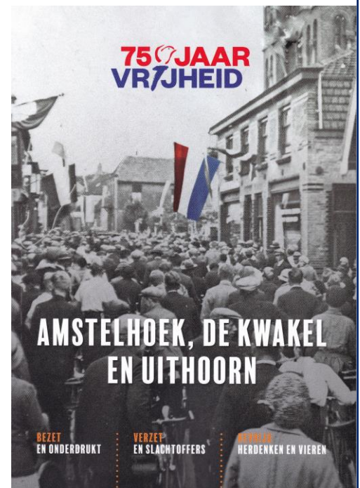
Voor- en achterzijde van het oorlogsboek.